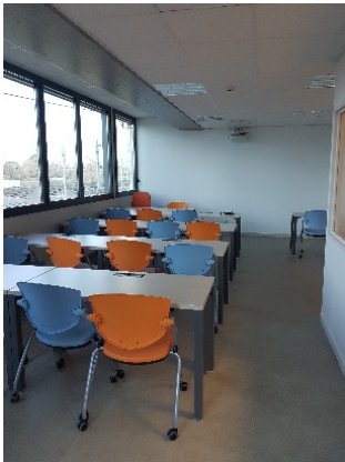
Salle Françoise Héritier