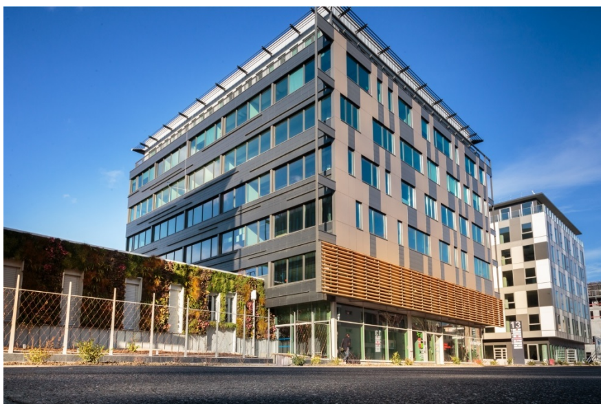
DOSSIER DE PRESSE – CAMPUS PROVISoire GRAND FORMA ANNEMASSE

13 Avenue Emile Zola 1 er étage 74100 Annemasse